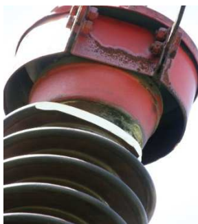
Slika 3. Oštećen potporni izolator rastavljača

Nepouzdanost napajanja i veliki broj kvarova utiču značajno i na materijalne i nematerijalne štete kod kupaca. Jedan od većih i svakako najznačajnijih kupaca na konzumu razmatrane TS je „Fabrike kartona Umka“. Po njihovim podacima materijalna i nematerijalna šteta koja je prouzrokovana propadima napona i prekidima u napajanju usled čega je došlo do prestanka rada fabrike i prekida proizvodnje, iznosi preko 200.000 € za 2015-tu godinu. Pored više sile svakako je značajna i odgovornost elektrodistributivnog preduzeća. Stoga ukoliko su očekivanja potrošača velika, u budućnosti se može očekivati sve veći pritisak kupaca prema operatoru distributivnog sistema na mogućnost sklapanja individualnih ugovora sa povećanom pouzdanošću (premium quality contract), odnosno spremnost potrošača da plati (willingness to pay) za bolji kvalitet isporuke električne energije.